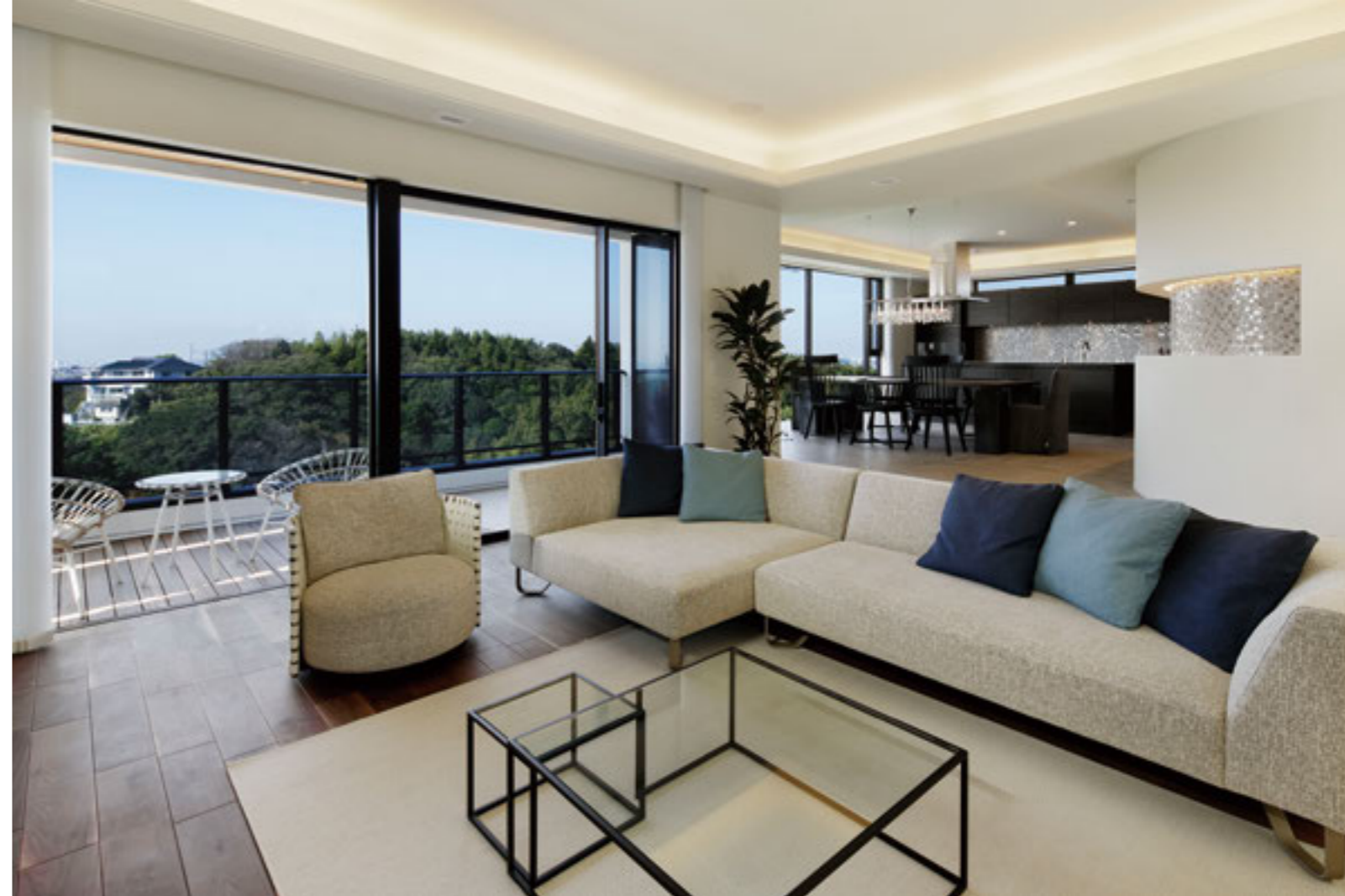
パノラマ状に広がる湘南の景色と富士山の稜線、夕日が海へと沈みゆく時のうつろいを存分に味わえるようにゾーニングされたLDK