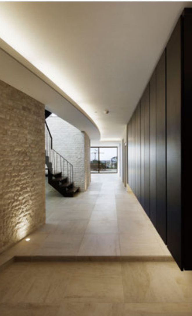
曲線の間接照明に導かれ、奥まで視線が抜けていくエントランスホール