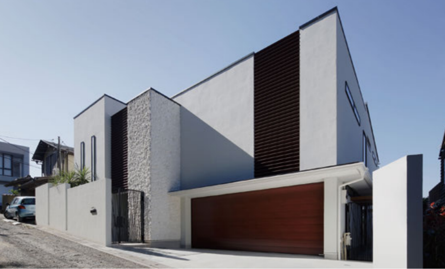
青空に良く映える素材感のある白い塗壁と珊瑚石、ウッドやアイアンによって洗練された外観となっている