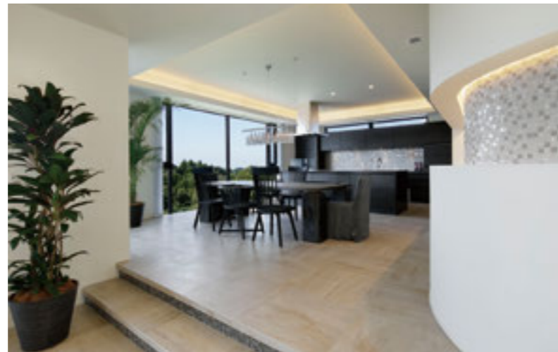
家具、照明、カーテンまでトータルコーディネートされたダイニング・キッチン