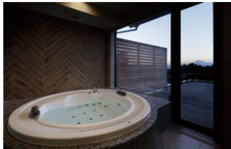
プライバシーを守りながら眺望も楽しめるバスルームはまさにラグジュアリー且つリラックス