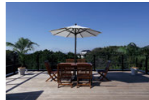
スローライフな至福のひとつを