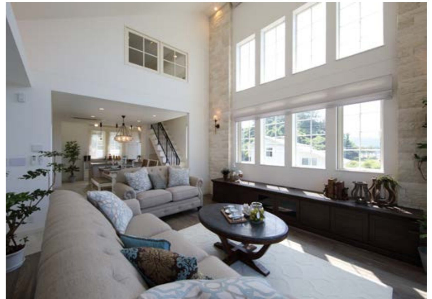
【ハウゼ】ではモダンスタイルから、エレガント、リゾート、さらに自然素材から先進機能の住宅まで、おおよそ考えられる「住まいのあり方」を 実際の建築実例として蓄積している。WEB上の施工実例動画には、オーナーが描く夢の暮らしがそのままに切り取られ紹介されている。

【個人住宅だってもっと自由になれる】 ハウゼではその考えを基に「ハウゼスタイル」という自社名を冠したコンセプトを提唱している。とかく厳しい住宅規制に縛られがちな神奈川・東京エリアだが、既成の概念にしばられない発想と企業姿勢によって、オーナーが本望に望む家を長年提供し続けている。 単なる施工会社でもなく、また建築家だけの集団でもない（ハウゼ）。ハウスメーカーとしての責任施工や長期保証、24時間対応のサポート体制による安心に加えて2020年新断熱性能基準義務化に向けたZEH登録ビルダーでもある。 常識にとらわれない唯一無二のライフスタイルを提案する設計事務所的な完全フリープラン、膝を交えて住まいづくりにとことん向き合う工務店ライクな一体感。デザイン性の高さも高機能、安全安心の住まいづくりを同時に実現できる同社のスタンスは、まさにオンリーワンのハウズビルダーである。