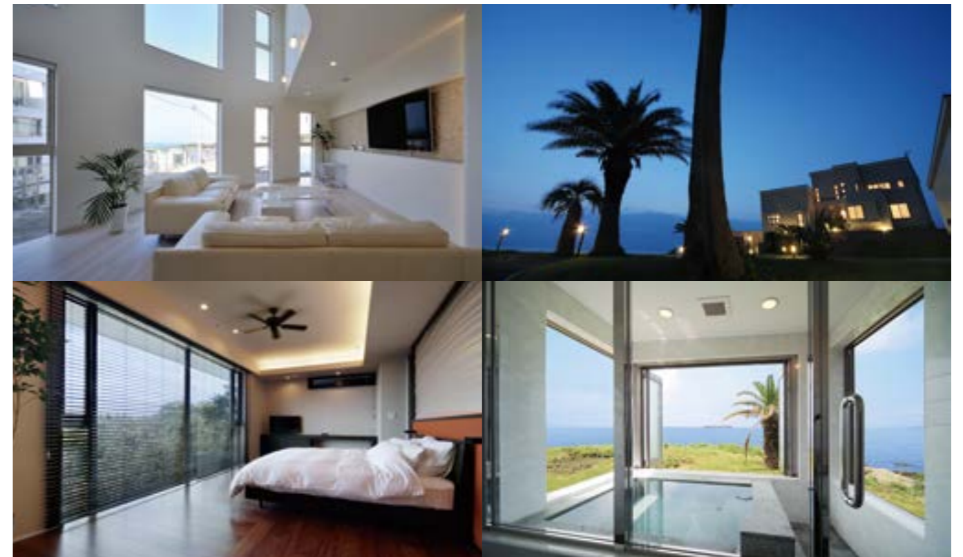
非日常の中で流れゆく時間はまるでリゾート ロケーションから創造される、様々な邸宅の佇まい