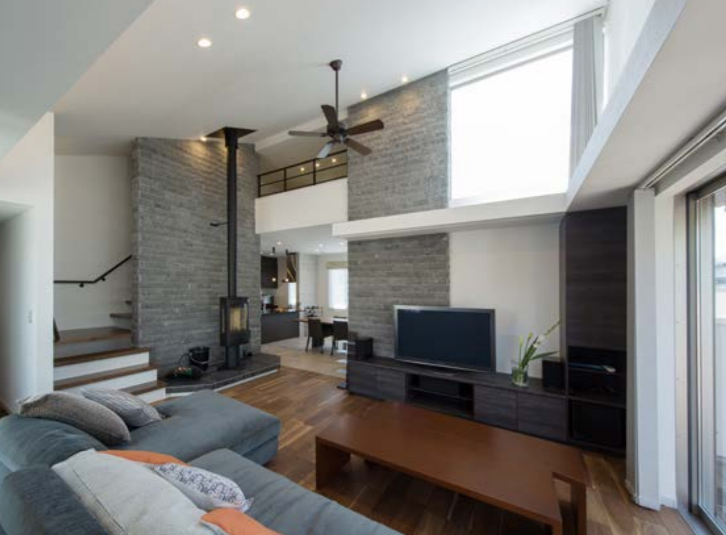
(上) 360度全てにこだわったリビング。2つのテラスに囲まれバーコーナーや暖炉、吹抜けにロフト、シアター設備等住まい手の想いが詰まった空間。