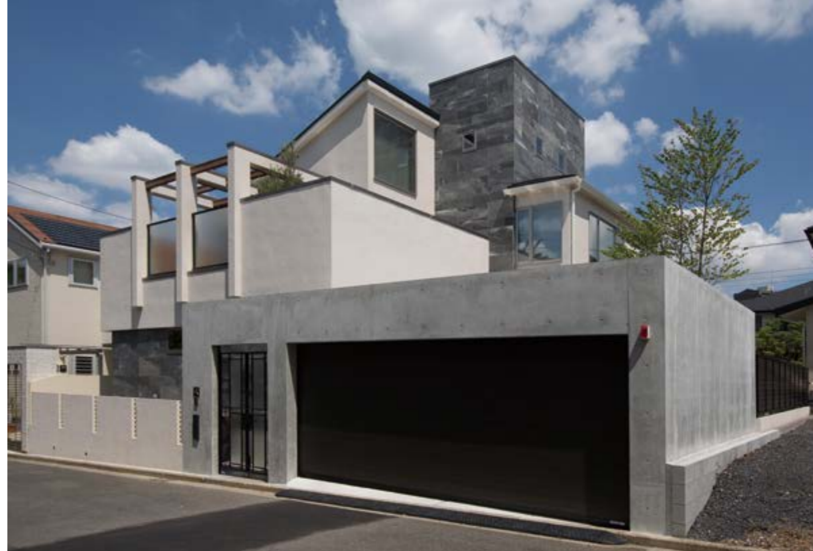
水平に伸びるRC打ち放しゲート、中心にそびえるタイルの塔、他にも木やガラス、アイアン等、多様な素材によって生まれる豊かな表情の外観が、港北ニュータウンの街並みと美しく調和しています。